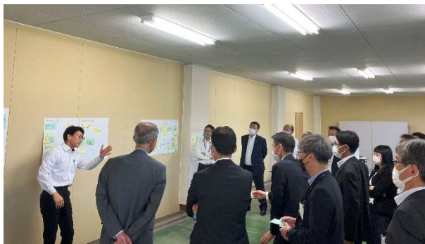
▲(左写真)第1回働き方改革課題解決特別タスクフォース 座長(副市長)挨拶 (右写真)幹部職員(部局長など)によるカエル会議(付箋ワーク)の様子